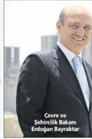
Çevre ve Şehircilik Bakanı Erdoğan Bayraktar

Bayraktar, Marmara Belediyeler Birliği ve Yıldız Teknik Üniversitesi (YTÜ) tarafından bakanlık desteğiyle düzenlenen 'Medya ve Halkla İlişkiler Boyutuyla Kentsel Dönüşüm Sempozyumu'nda konuştu. Bayraktar, Türkiye'de 6.5 milyon konutun zaman içinde mülkiyet verileri gerektiriyor vurgulayarak, "Bu dünyanın en zor işi. Bu iş için ciddi kaynak lazım. Vatandaş ve devletin bu işi işçileşmesini, kabul etmesi lazım" dedi.